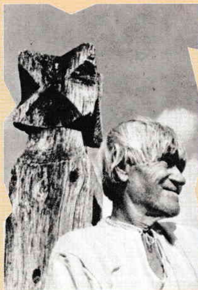
Fotografie document înfățișând un țaran din Oaș, asemănător cu dacii descriși în izvoarele antice.

(Constantin C. Giurescu, Romanismul dacic , în Magazin istoric , nr. 8/1973)